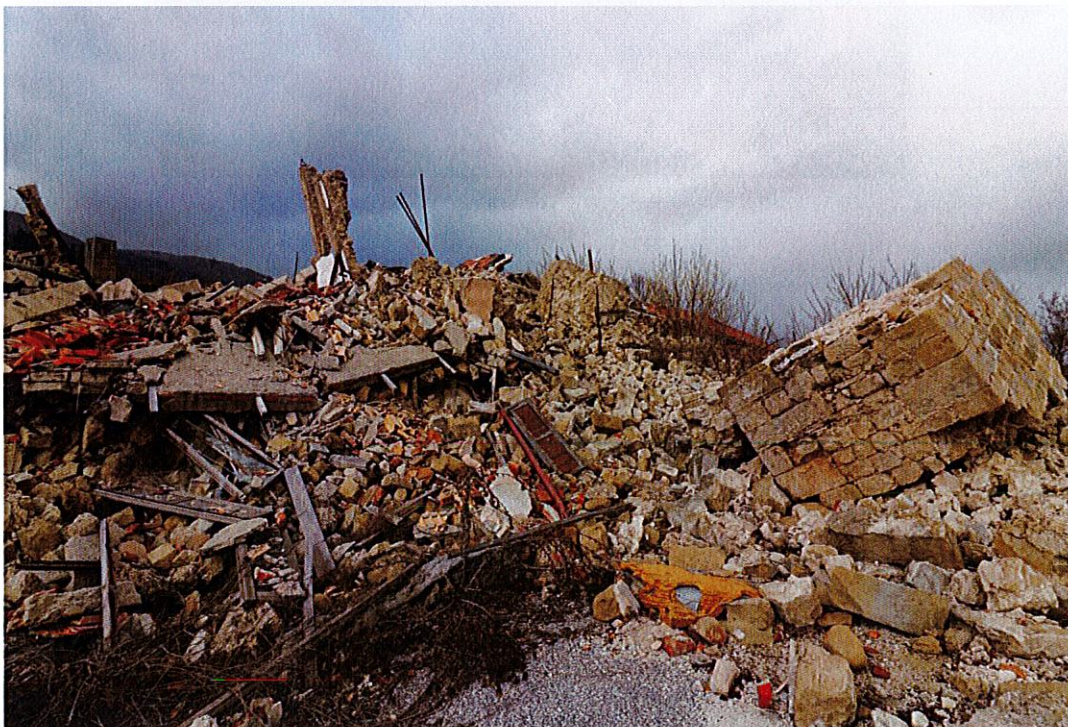
Macerie da rimuovere. Si evidenziano i resti del campanile