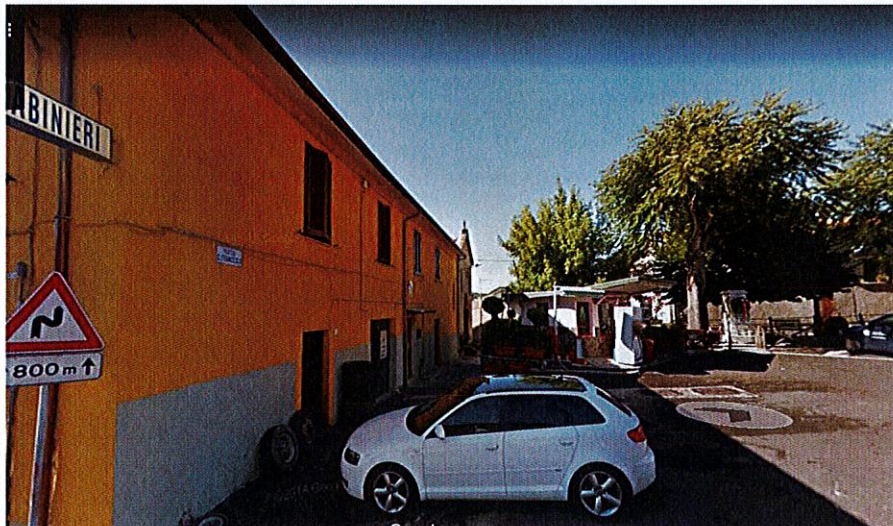
Documentazione fotografica ante sisma 2016 della piazza San Francesco