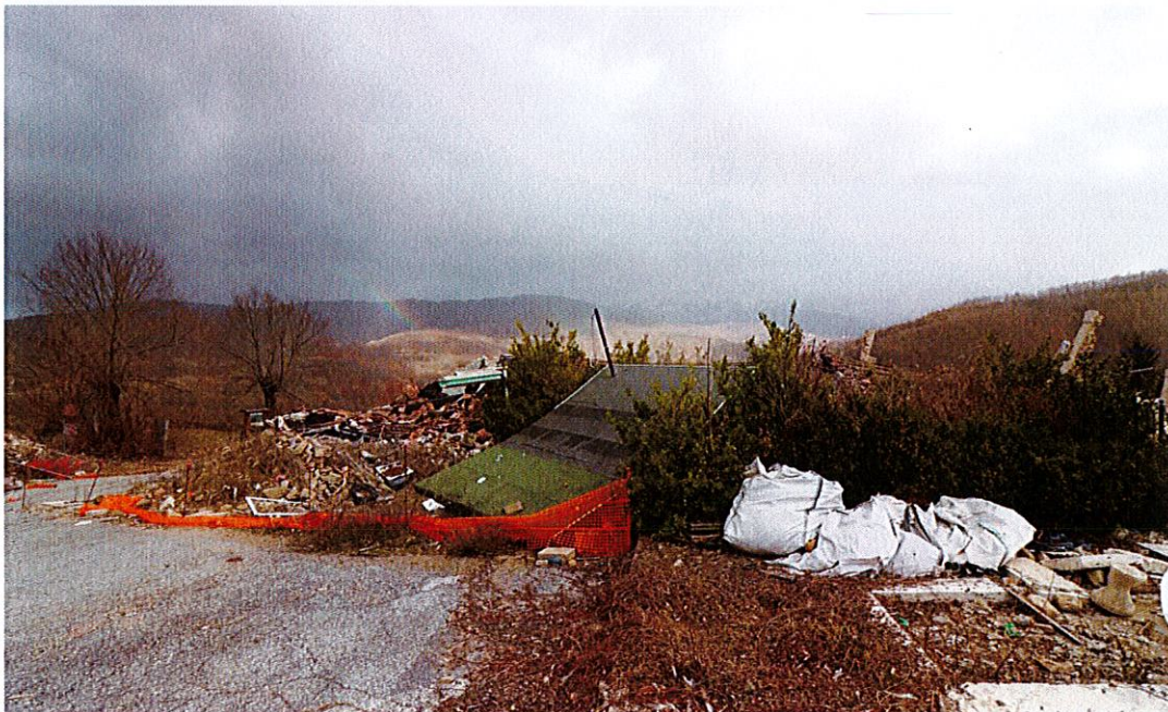
La piazza San Francesco dopo il sisma 2016